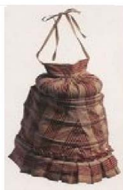
6. ábra: Turnűr

Az 1870-80-as évektől a turnűrös szoknya volt divatban. A turnűr tulajdonképp egy lószőrrel kitömött párna, vagy fémpántból, halcsontból készített szerkezet, amelyet a fenék felett szalagokkal kötöttek a derekukra. A karcsúság hangsúlyozására továbbra is használták a fűzőt is. A szoknyák fodrosak, uszályosak voltak.