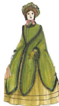
4. ábra: Angol hölgy 1845-ben

Kedvelt kiegészítő ruhadarab a nagy háromszögletű, selyemből vagy gyapjúból készült kendő. Kitűzők, karórák, feltűnő ékszerek voltak a nőknél, a férfiak nyakkendőket, kézelőgombot hordtak.