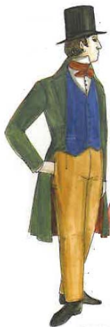
3. ábra: Angol úr 1845-ben

1860-ban már az öltöny szóval barátkoztak az emberek, a frakk ünnepi alkalmak viseletévé vált. A színek sötétebbek, sokszor a nadrág, a zakó és a mellény ugyanolyan színű volt. A keményített levehető gallér és a csokornyakkendő kiszorította a divatból a „fátermörder”-t, a század elején magasra ívelt és keményített inggallért. Utóbbi azért kapta az „apagyilkosság” nevet, mert egy történet szerint egy fiú apját ezzel a gallérral ledöfve ölte meg. Divat lett a kockás és csíkos nadrág, melyet magasabbra és bővebbre, tehát kényelmesebbé szabtak a szabók. Nincs a nadrágokon él és aljafelhajtás sem.