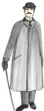
5. ábra: Angol úr 1898-ban

A század vége felé, míg a nők egyre díszesebben öltözködtek, addig a férfiak ruhatára egyszerűsödött. A férfiak dolgoztak, így kényelmes, letisztult öltözékre volt szükségük, gazdagságukat pedig hölgyeik ruhatárán keresztül mutatták meg.