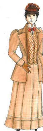
7. ábra: Angol hölgy 1894

A hölgyek hajukat tarkón vagy fejtetőn kontyba kötötték és megjelent a fru-fru. A frizurát gyöngyökkel, drágakövekkel, hajhálóval díszítették. A kontyot nappal kalap alá rejtették. A kalapok egyre nagyobbak és díszesebbek lettek. A monumentális kalapok ellen a „színházigazgatóknak például intézkedéseket is kellett hozniuk, hiszen sok néző nem látott a hölgyek fejfedőitől. Emiatt dobtak piacra 1885-ben olyan női kalapokat, amelyek a férfiakéhoz hasonlóan könnyen összenyomhatóak voltak, így a nők az előadás alatt kényelmesen az ölükben tarthatták.” 8 A nagy kalapokon sok hely volt a díszítésnek: „A kalapokra kész gyümölcsligetek kerültek levelestül, gyümölcsöstül, lepkéstül, madárfészkestül. Akik ennél többet engedhettek meg maguknak, azok ritka madarak tollával felcícomázott kalapokat viseltek. Akiknek pedig a madár tolla nem volt elég, azok tollak helyett kitömött énekesmadarakat