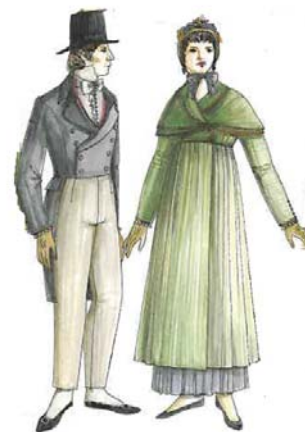
1. ábra: Angol pár 1810-ben

A századelőn az angol nők is egyszerűsítették ruhatárukat, megszabadultak a hatalmas alsószoknyáktól és az uszályoktól, utóbbi csak báli viseletnél jelent meg. „A dekoltázs kisebb lett, ugyanakkor elterjedt a mély hátkivágás. A szoknya szűkebb és rövidebb lett, az övek, vagy széles szalagok még mindig természetellenesen magasan, a mellék alatt helyezkedtek el.” 3